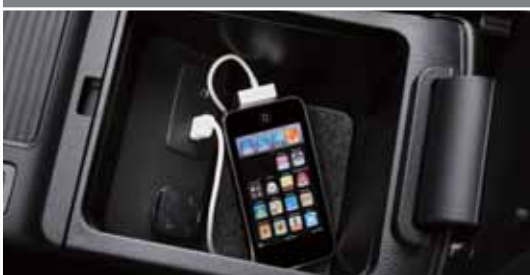
Lisaaudio ja USB-sisendpistik