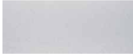
SPARK SILVER METALLIC