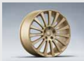
19" kergsulamveljed, kuld