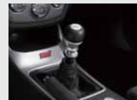
19" kergsulamveljed, hõbe