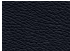
KÜLJED: MUST NAHK*

* Mõned istme osad on kaetud kunstnahaga (PVC).