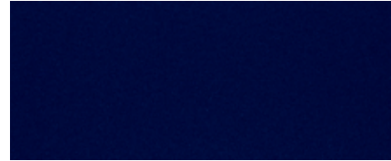
PLASMA BLUE SILICA