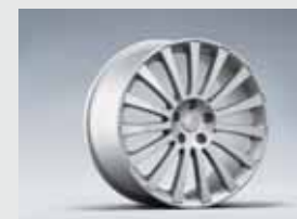
STI käigukangi nupp, alumiinium ja nahk