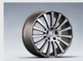
19" kergsulamveljed, antratsiit