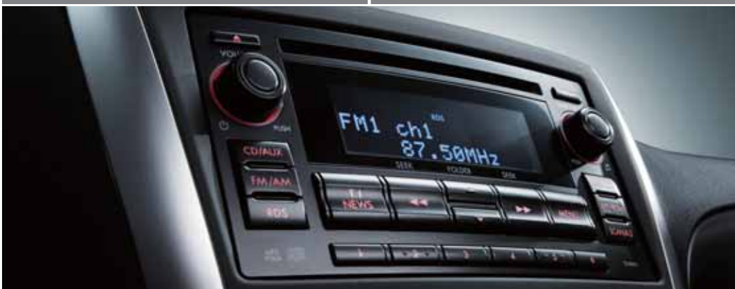
10 kõlariga tipptasemel helisüsteem