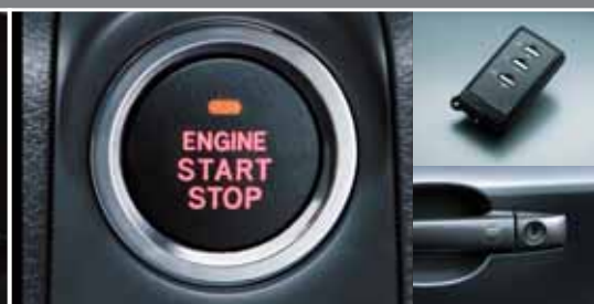
Võtmeta juurdepääs ja nupuga käivitamine