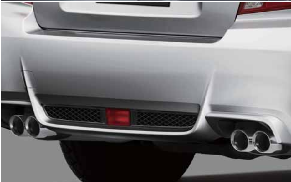
Tagadifuuser ja topeltavadega summuti